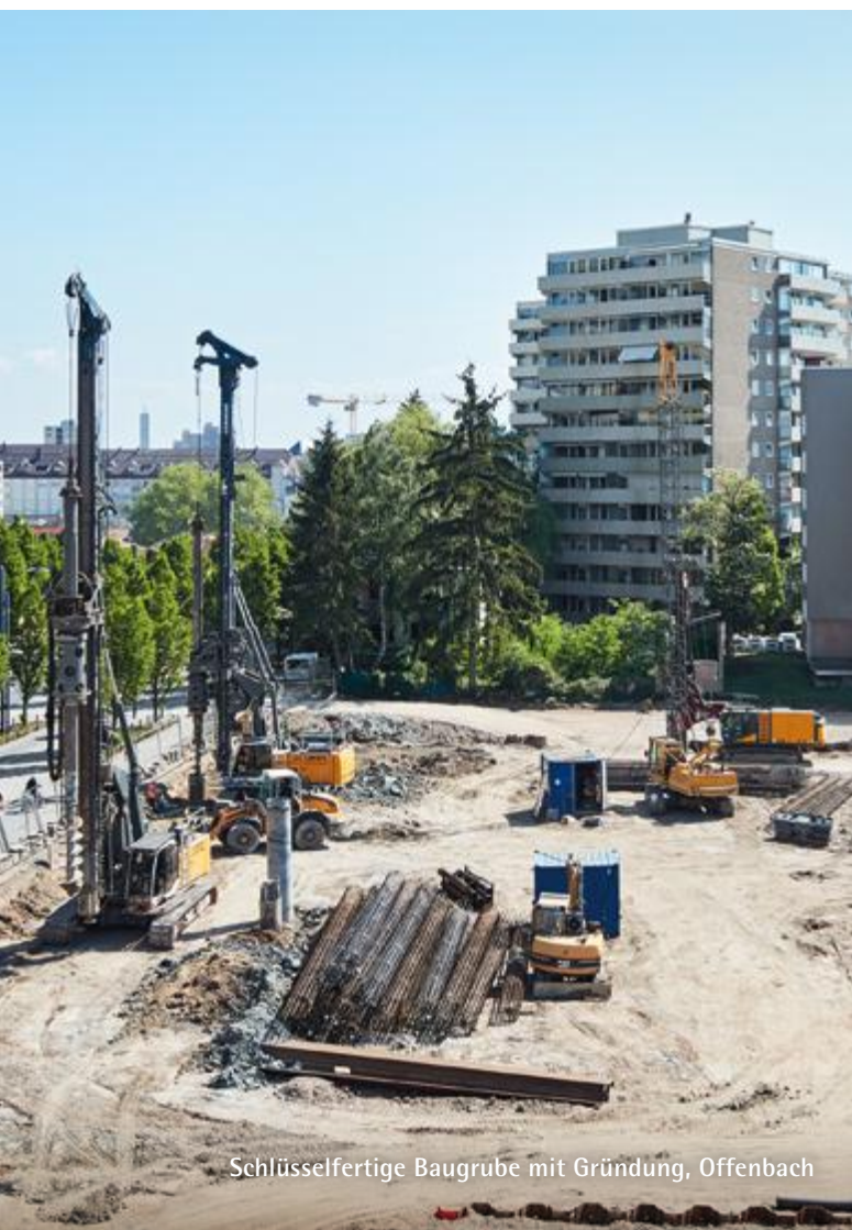
Schlüsselfertige Baugrube mit Gründung, Offenbach