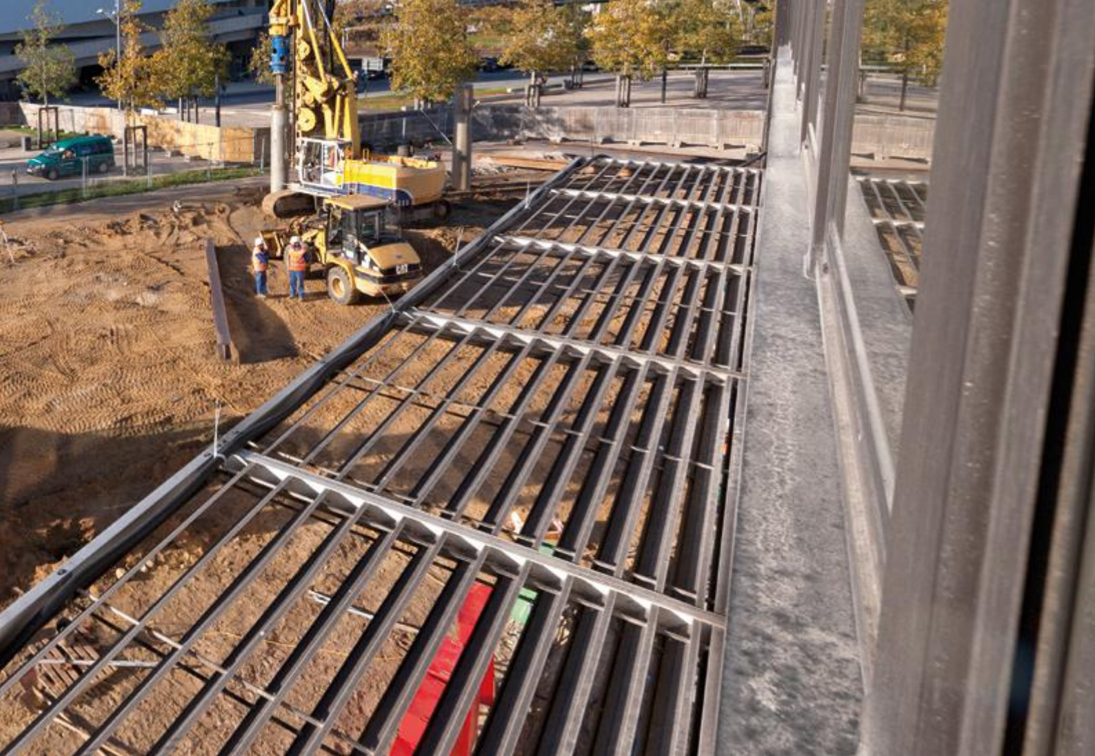
Stadtwerke Wolfsburg AG, Wolfsburg